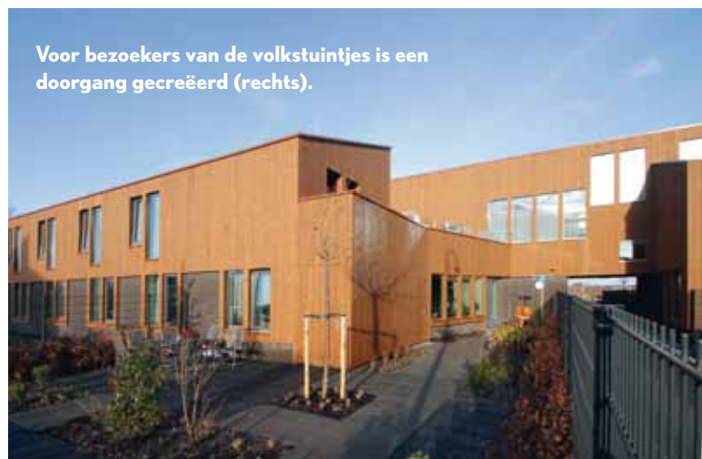
Voor bezoekers van de volkstuintjes is een doorgang gecreëerd (rechts).

Van beide materialen werden fijnbezaagde ruwe planken aan de gevel bevestigd. "Aan de hand van kleurmonsters zijn de gevels uiteindelijk afgewerkt in een roestbruine kleur. Het Plato vuren kreeg twee behandelingen; het douglas werd verduurzaamd, brandvertragend gemaakt en vervolgens twee keer behandeld", schrijft Stiho, die dit werk liet uitvoeren door